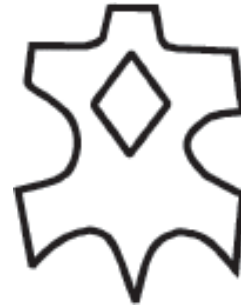
Кожа с покритие