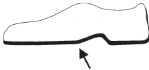
Външно ходило (Подметка)